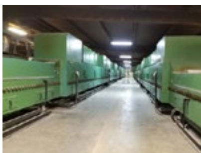
Aeroflex plant in USA