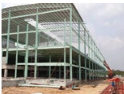
The new Aeroflex5 plant in Rayong with total factory area of 15,000 sqm.

In addition, Aeroflex has improved the logistics system in the USA to be more convenient and faster. Aeroflex will also gradually invest in the automation production system to enhance the efficiency and reduce the production costs. The market in the USA still has a good growth opportunity due to the demand of products for offices, industrial plants and residences.